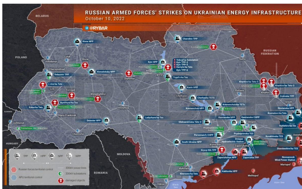
Ουκρανία: Τα σημεία των ρωσικών βομβαρδισμών σε μία μέρα, 10/10/2022.